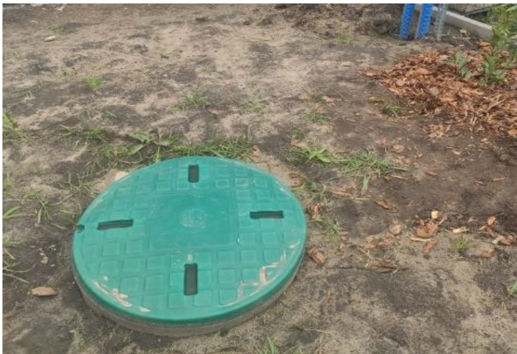
Przydomowa pompownia w msc. Ruszcza na działce nr 140/9

W dniu 04.08.2022 r. podpisano umowę nr GOS.271.157.2022.KGOS z Przedsiębiorstwem Gospodarki Komunalnej w Połańcu sp. z o.o. z siedzibą w Połańcu ul. Krakowska 11 na wykonanie 10 sztuk pompowni w tym: 1 pompownia w Ruszczy, 3 pompownie w Rybitwach, 3 pompownie w Rudnikach, 2 pompownie w Połańcu, 1 pompownia w Zrębinie. Zamawiający zobowiązał się zapłacić Wykonawcy wynagrodzenie ryczałtowe za przedmiot zamówienia 175 976,86 zł, brutto łącznie z VAT 23%. Termin wykonania zadania 04.10.2022 r.