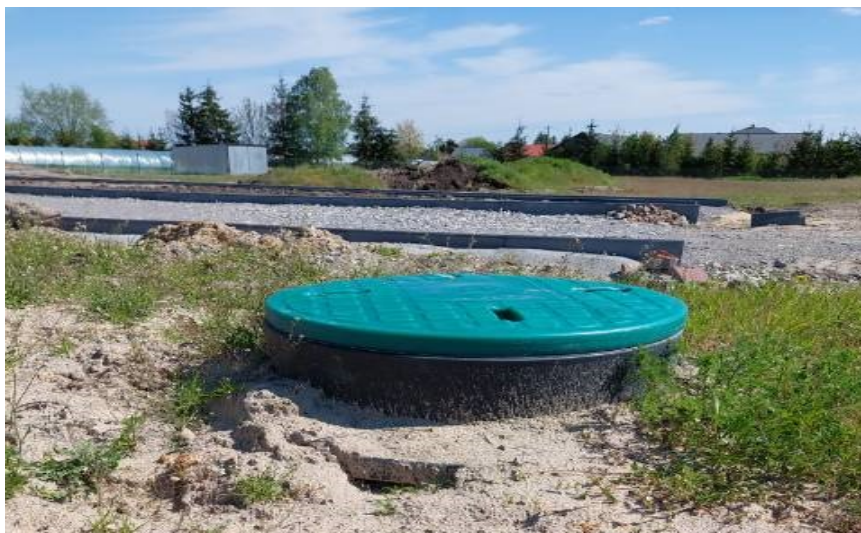
Przydomowa pompownia w msc. Ruszcza na działce nr 140/9