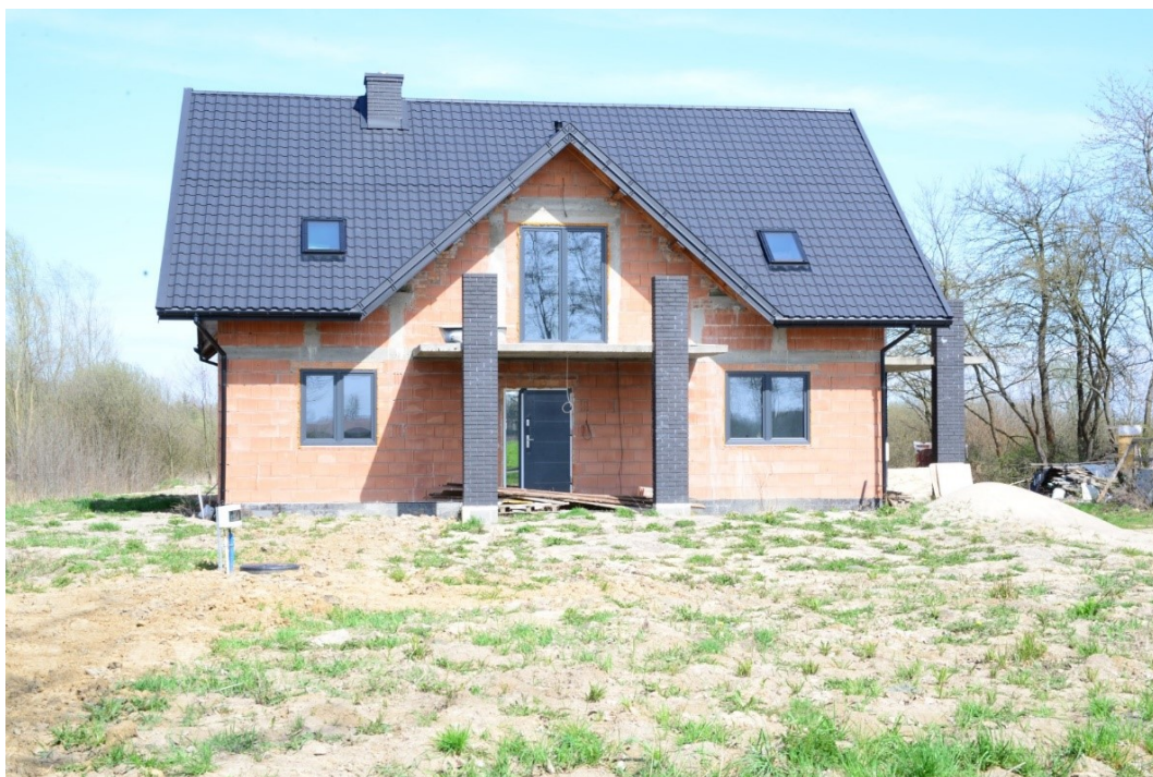
Przydomowa pompownia w msc. Tursko Małe Kolonia na działce nr 31/1

W dniu 28.11.2022 r. podpisano umowę nr GOS.272.297.2022.KGOS z Przedsiębiorstwem Gospodarki Komunalnej w Połańcu sp. z o.o. z siedzibą w Połańcu ul. Krakowska 11 na wykonanie 7 sztuk pompowni w tym: 1 pompownia w Tursku Małym Kolonii, 2 pompownie w Wymysłowie, 1 pompownia w Tursku Małym, 1 pompownia w Ruszczy, 2 pompownie w Połańcu. Zamawiający zobowiązał się zapłacić Wykonawcy wynagrodzenie ryczałtowe za przedmiot zamówienia 197 866,42 zł, brutto łącznie z VAT 23%. Termin wykonania zadania 28.03.2023 r.