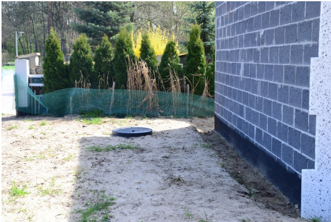
Przydomowa pompownia w msc. Połaniec na działce nr 2683/2