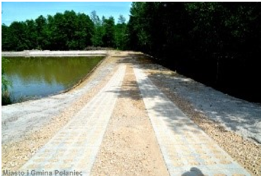
Miasto i Gmina Połaniec